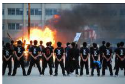
ファイヤーストーム

本番の3日間やその前の準備の時間から、クラスや部活動での連携が深まり、西高全体が一体となったとても素晴らしい西高祭となりました。