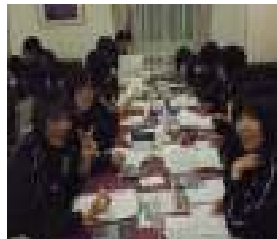
夜はホテルで簿記補習