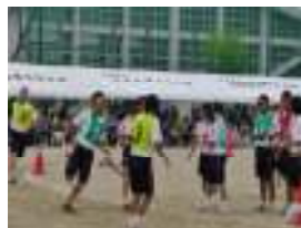
クラス対抗リレー