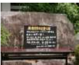
原爆受難者慰霊之碑

全校登校日の8月9日(水)に本校にある「原爆受難者慰霊之碑」の前で、慰霊祭が執り行われました。本校からは生徒会役員が生徒代表として参加し、原爆で亡くなった方々の魂を同級生の方々とともに慰霊しました。