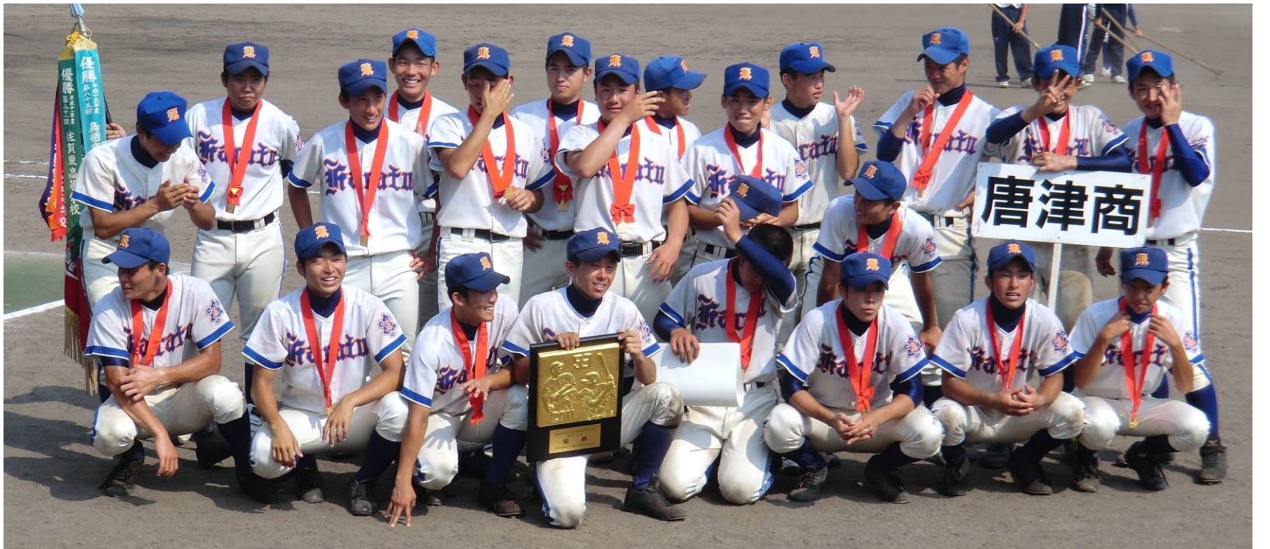
第93回全国高校野球選手権佐賀大会の決勝が24日、佐賀市のみどりの森県営球場で行われ、唐津商が佐賀工を破って、27年ぶり4回目に全国大会出場を決めた。