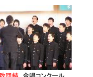
一致団結 合唱コンクール