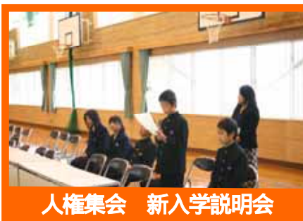
人権集会 新入学説明会