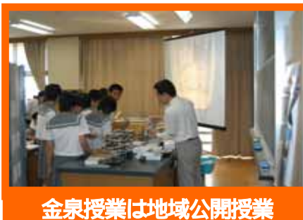
金泉授業は地域公開授業