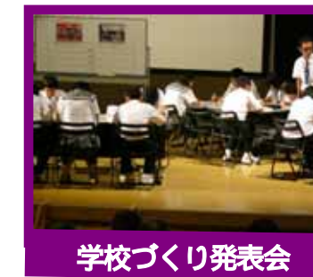
学校づくり発表会