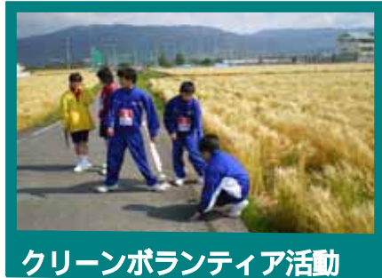
クリーンボランティア活動

一人一人の活動を参観している保護者、地域の方が褒めます 一人一人の活動を見守る教職員が、賞賛の言葉をかけます 生徒一人一人が、一人一人の役割を認め、成し遂げたときに賞賛します